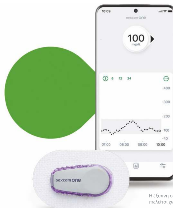
Η έξυπνη συσκευή πλωύεται χωριστά.

*Εάν οι ειδοποιήσεις γλυκόζης και οι ενδείξεις από το Dexcom ONE δεν συνάδουν με τα συμπτώματά ή τις αναμενόμενες τιμές, χρησιμοποιήστε έναν μετρητή γλυκόζης αίματος για να λάβετε αποφάσεις για τη θεραπεία του διαβήτη.