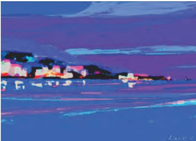
Mediterranean Night 1 (digital painting by Alexis)