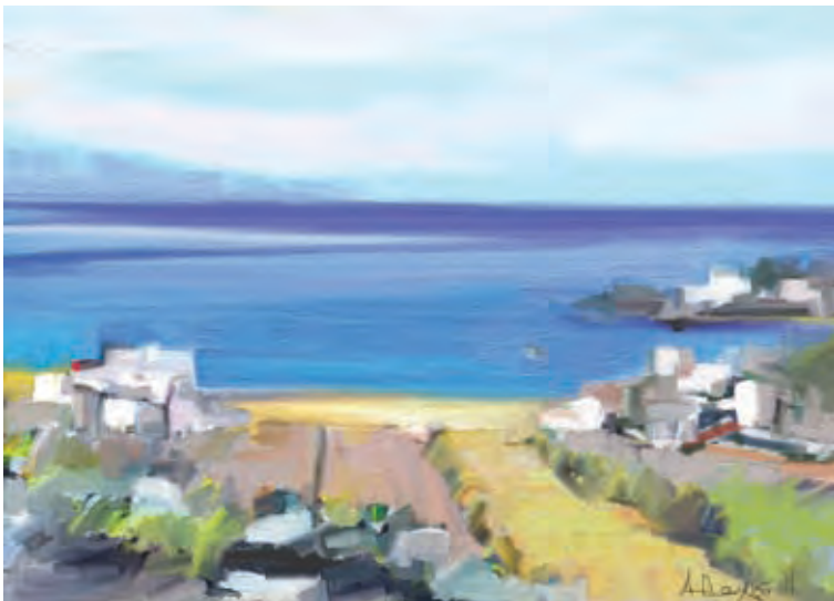
Kyklades 1 (digital painting by Alexis)