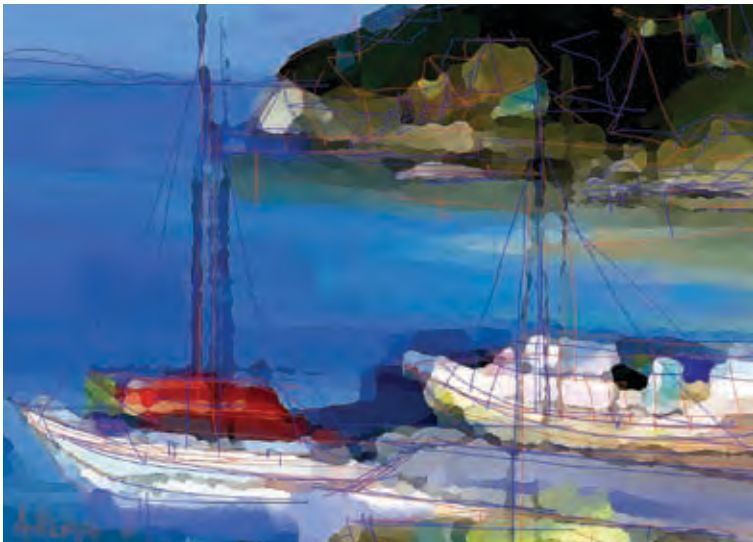
Parga Detail (digital painting by Alexis)