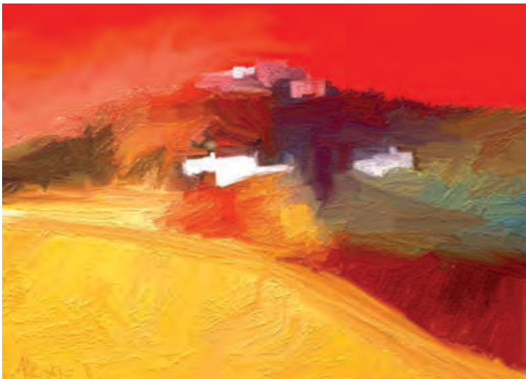
Mesogeia Hills 2 (digital painting by Alexis)