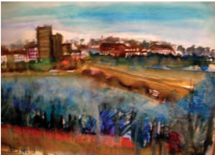
Paris A (digital painting by Alexis)