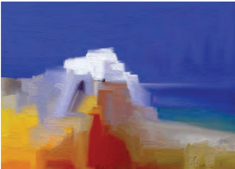
White Island 5 (digital painting by Alexis)