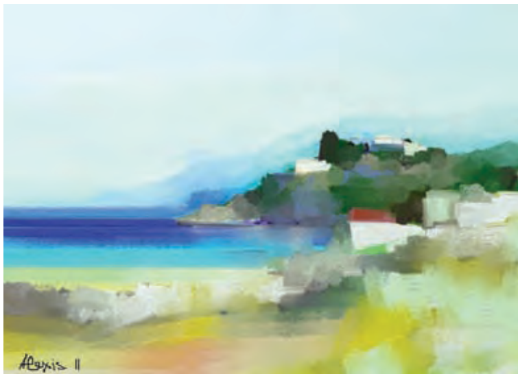
Seaside 3 (digital painting by Alexis)