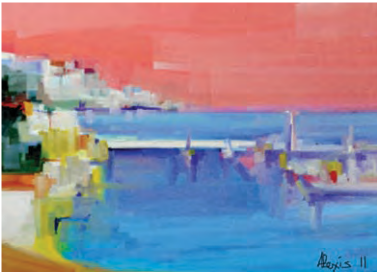
Ais 1 (digital painting by Alexis)