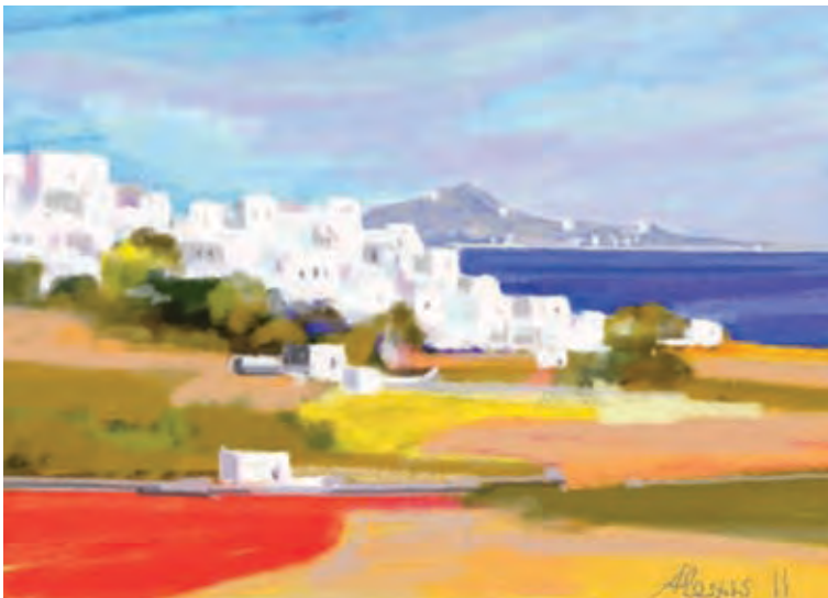
Kykladitiko 5 (digital painting by Alexis)