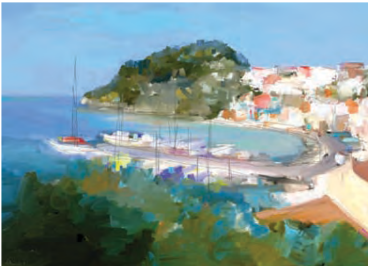
Parga Ponte 1 (digital painting by Alexis)