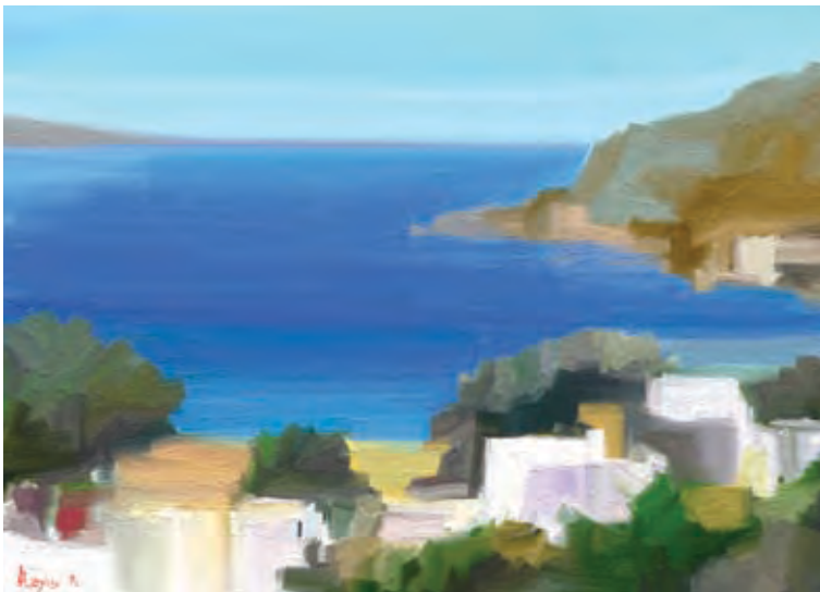
Kyklades 2 (digital painting by Alexis)