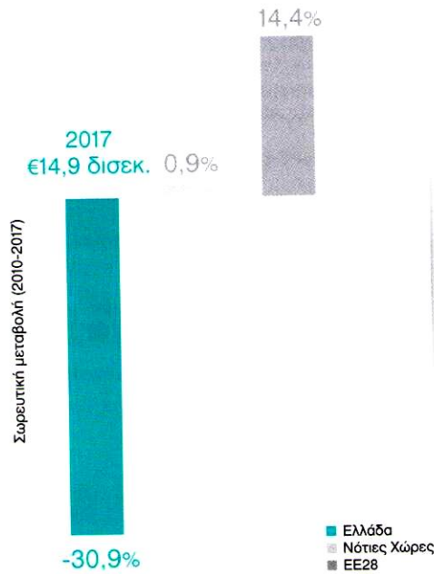
Συνολική χρηματοδότηση για δαπάνες υγείας